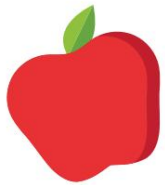
Pommes à peau rouge