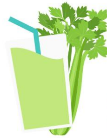
Jus de Céleri