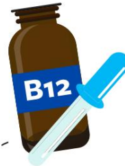
adénosylcobalamine et méthylcobalamine