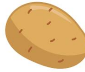
Pommes de terre

(comprend les cinq aliments clés pour éliminer les métaux lourds: myrtilles sauvages, spiruline, coriandre, poudre de jus d'herbe d'orge, dulse de l'Atlantique. Vous pouvez les déguster dans la recette de smoothie Heavy Metal Detox ou manger les cinq ingrédients séparément quotidiennement)