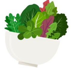
Laitue (variétés feuillues et vert foncé ou rouge)